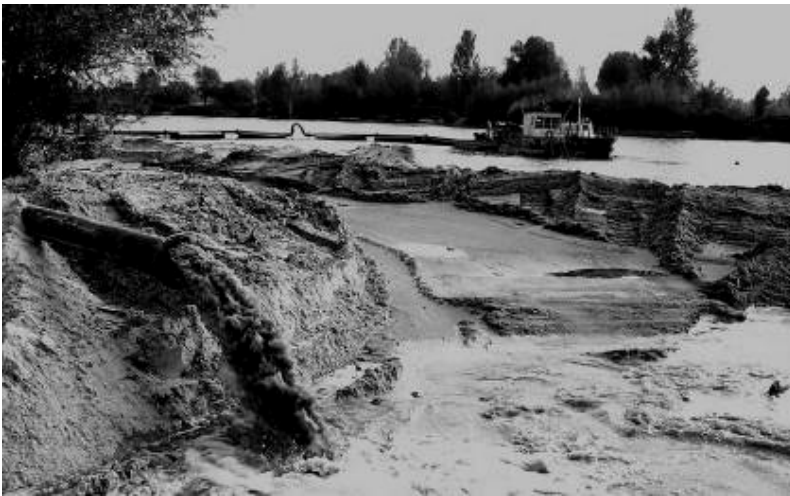
Гідронамив під будівництво на березі Десни у с. Зазим'я, 2005 р.