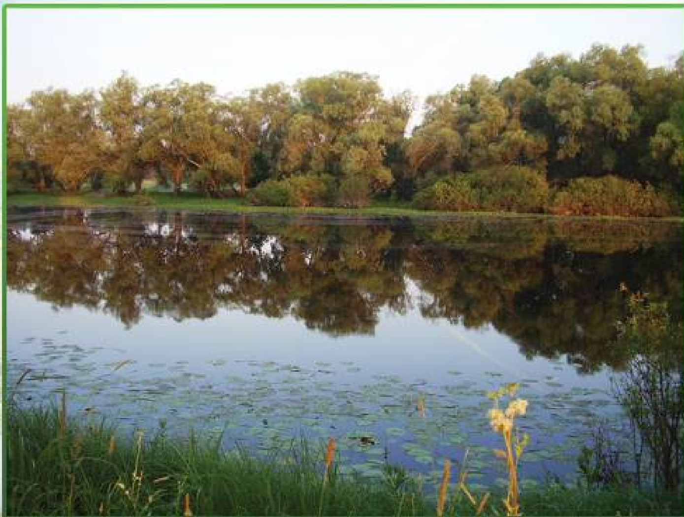
Макет: територія Коломишцев

Створимо національний природний парк «Подесіння»!