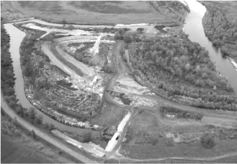
Гідронамив, будівництво каналів та котеджів у с. Соболівка на березі Десни, 2008 р.